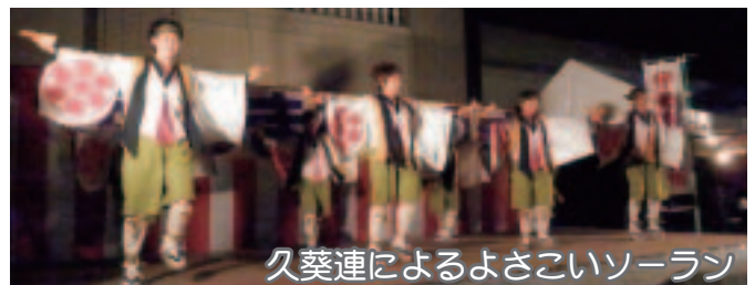
久葵連によるよさこいソーラン