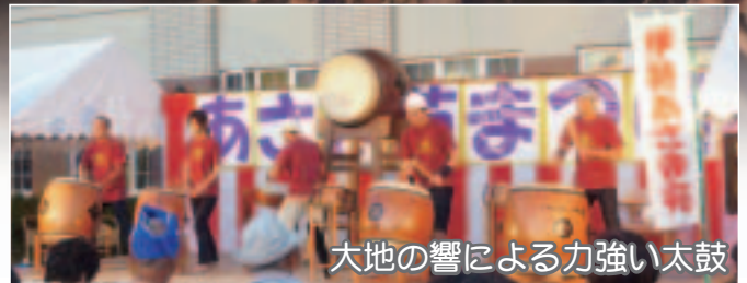
大地の響による力強い太鼓