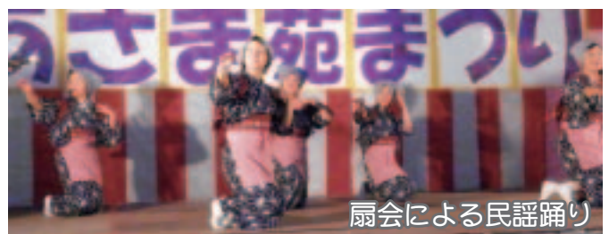
扇会による民謡踊り